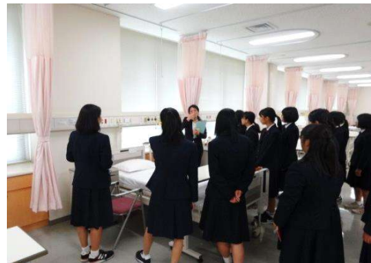
学内見学：成人看護実習室