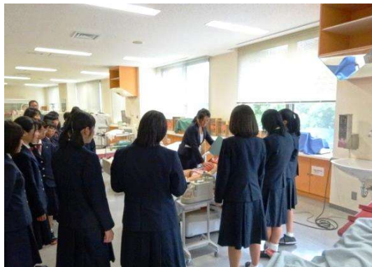
学内見学：母性・小児看護実習室