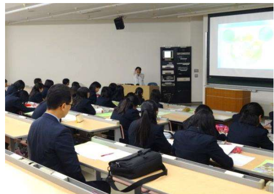
教室での本学概要の説明