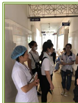
郡病院 地域病院としての役割と省病院やヘルスセンターとの連携について学びました。