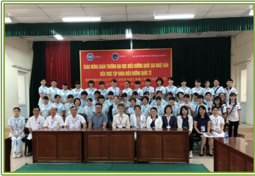
省病院 (Hai Duong General Hospital) 省内唯一の三次医療病院です。