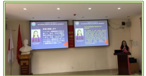
HMTU 学長より歓迎のご挨拶をいただきました。 この後、ベトナムの保健医療システムと看護教育についての講義および HMTU カリキュラムの紹介がありました。