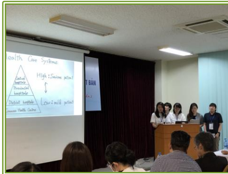
実習成果発表 @ Bach Mai Hospital グループごとに実習の成果を英語で発表しました。