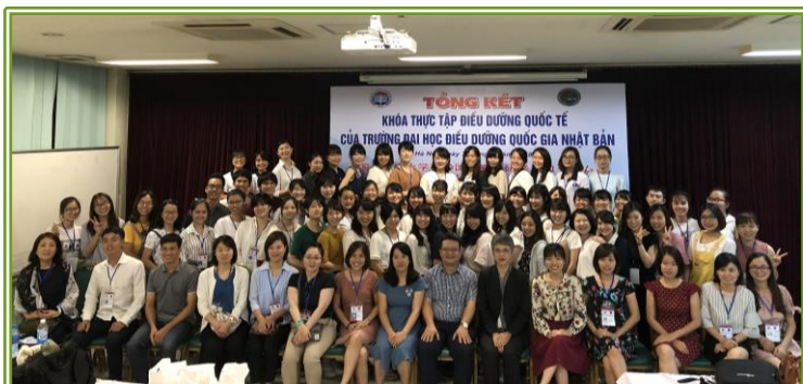
HMTUの先生方からも講評をいただきました。「ベトナムそして日本の看護の発展に尽力し、ぜひ両国のかけ橋になってほしい」と、学生への激励のお言葉をいただきました。