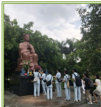
はじめにベトナム医学発展の師にお参りました。