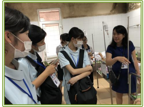
実習中は英語で一生懸命質問しました。HMTUの教員や学生さんも熱心に学生をサポートしてくれました。