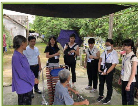
社会福祉施設、ハンセン病療養施設 政策や施設における看護職の役割を学びました。入居者からお話も伺いました。