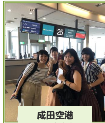
成田空港 行ってきます!!

国際看護学実習 II は、多くの学生にとってベトナムの保健医療システム、患者さんの療養環境や看護実践に初めてふれる機会となっています。ベトナムと日本との違いや共通する課題を理解し、改めて看護職の役割を考えることで自らの看護観を深めることができました。