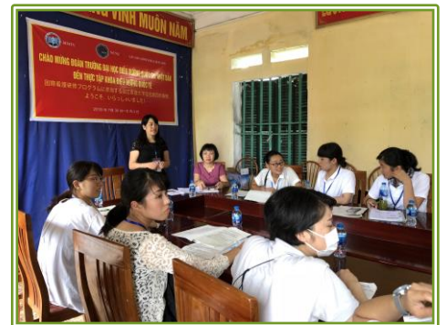
コミュニンヘルスセンター 予防と一次医療を担うヘルスセンターの役割を学びました。