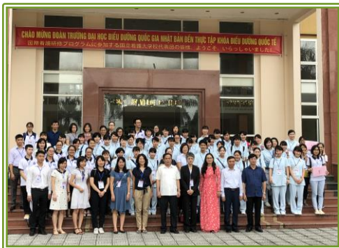
ハイズオン医療技術大学 (HMTU) 横断幕を掲げて歓迎してくださいました。