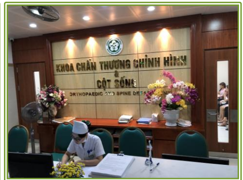
中央病院 (Bach Mai Hospital) ハノイ市内にあるベトナムで最も大きな病院のひとつで、先端医療を提供しています。