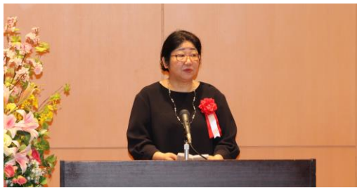
厚生労働省大臣官房 森光敬子 危機管理・医務技術総括審議官 ご祝辞