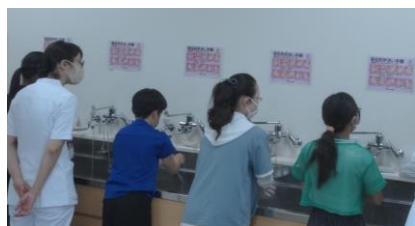
病院での手洗い方法の図を見ながら洗いました