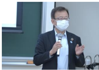
清瀬市教育委員会 坂田篤 教育長 挨拶