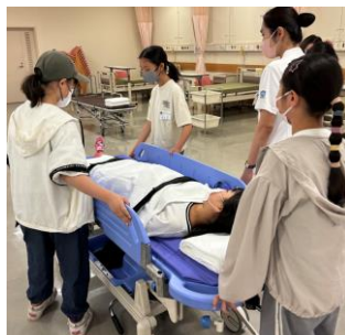
患者体験もしました 患者役ではどんな気持ちになったかな？