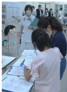
洗い残しはあったかな？