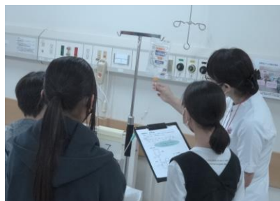
6秒間に5滴落とせるように調節しました 皆さん苦戦していました