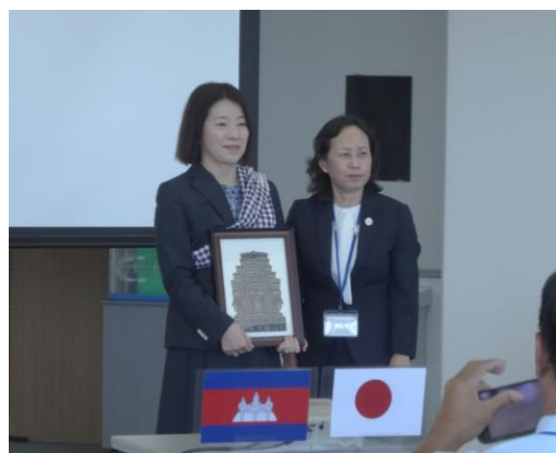
レザールートをいただきました！