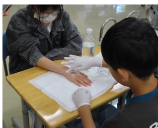
傷の周りを石けんで洗う 「そおっと洗いますね」