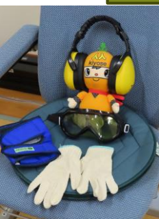
グッズを使ってお年寄りの体験をしました