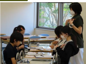
胸とお腹の聴診 「聴こえた!」