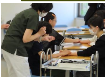
1分間の脈拍測定 数えるのが難しい