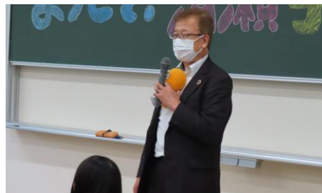
清瀬市教育委員会 坂田篤 教育長 挨拶