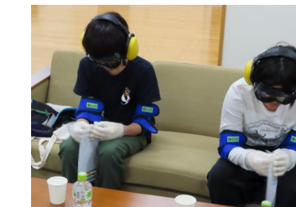
うごきにくい手で袋から薬を出してみよう 「こんなに出しにくい!」