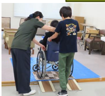
坂道やデコボコ道では押す力がたくさん必要だね